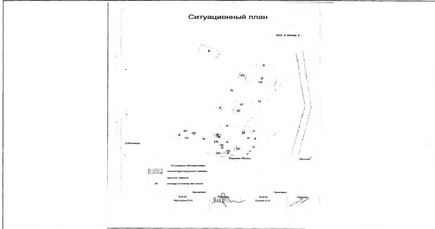
Схема расположения объекта недвижимого имущества на земельном(ых) участке(ах):