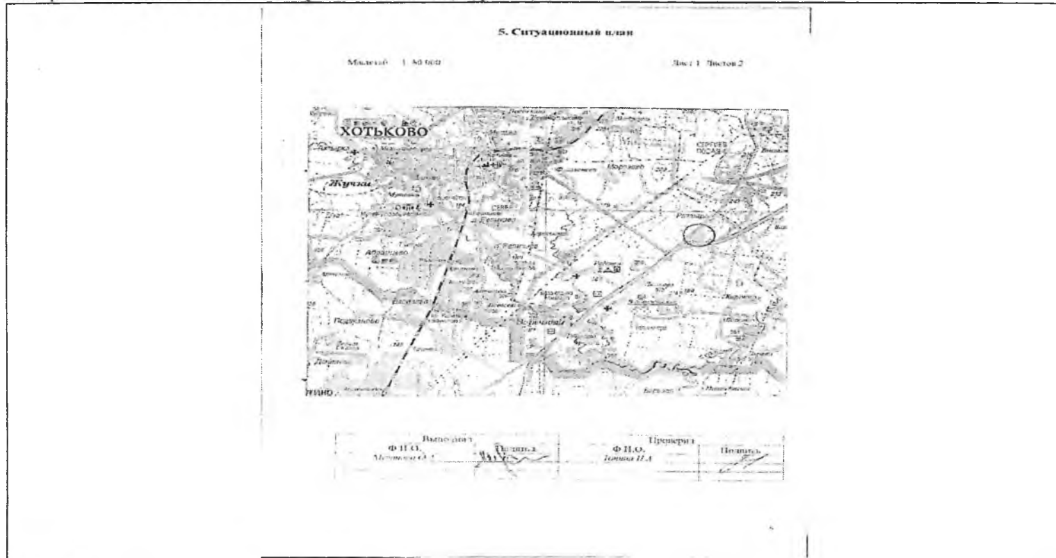
Схема расположения объекта недвижимого имущества на земельном(ых) участке(ах):