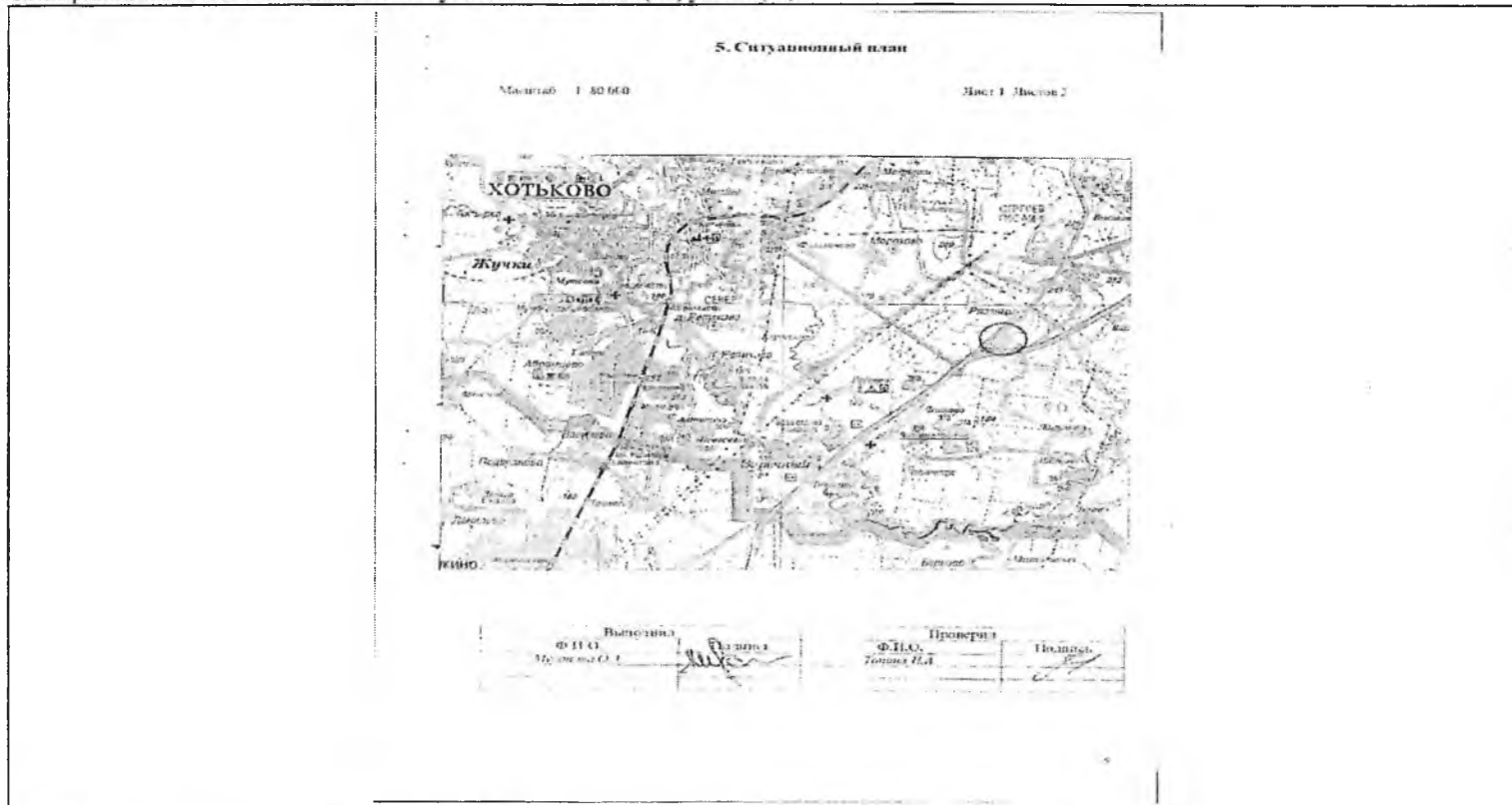
Схема расположения объекта недвижимого имущества на земельном(ых) участке(ах):