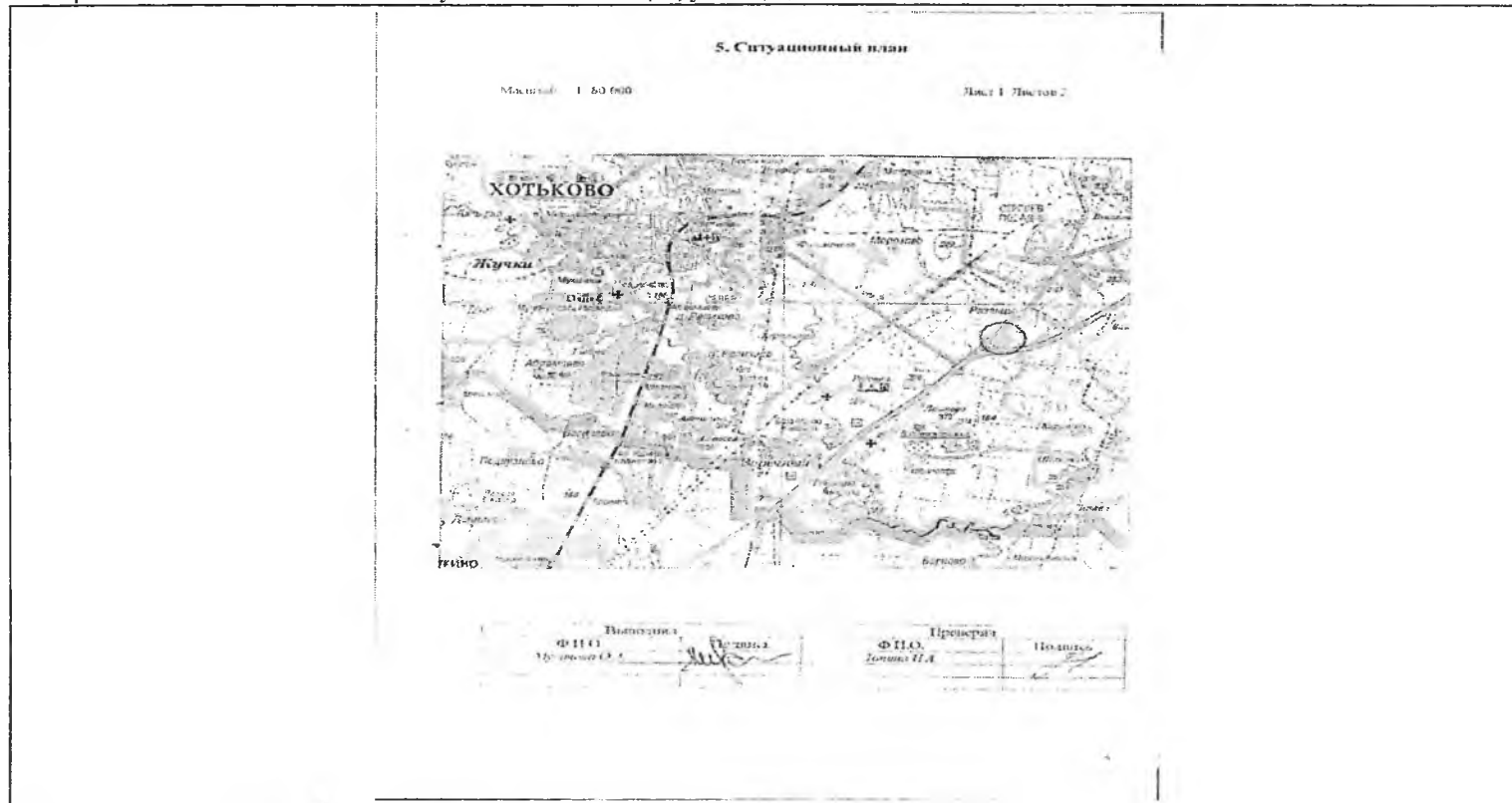
Схема расположения объекта недвижимого имущества на земельном(ых) участке(ах):