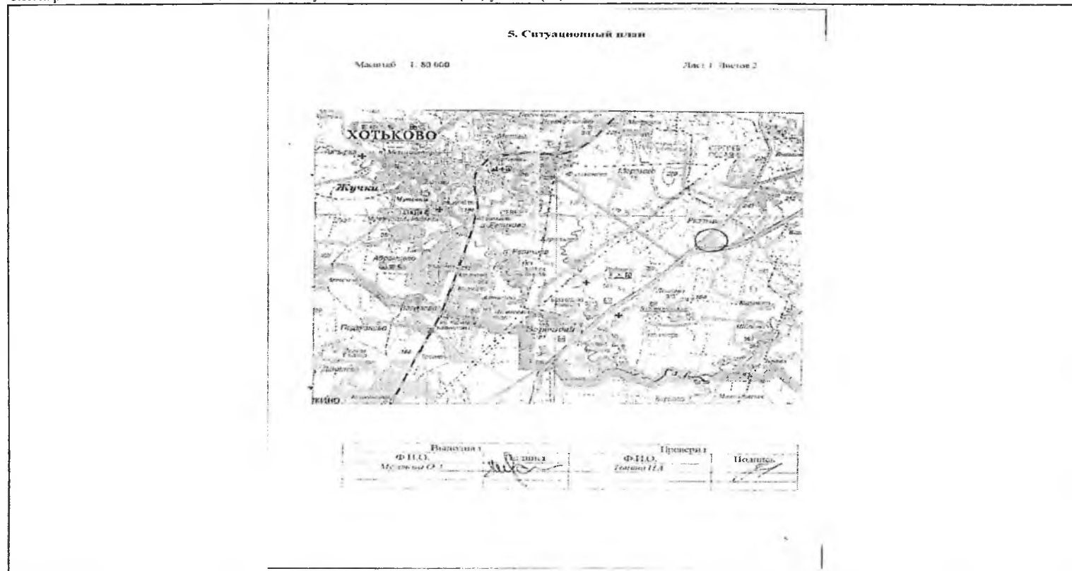
Схема расположения объекта недвижимого имущества на земельном(ых) участке(ах):