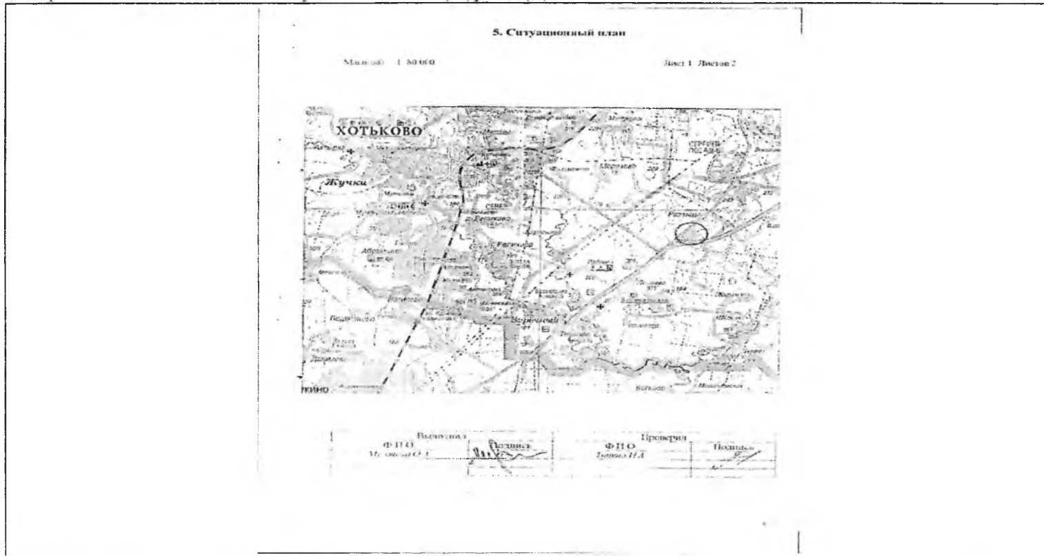
Схема расположения объекта недвижимого имущества на земельном(ых) участке(ах):